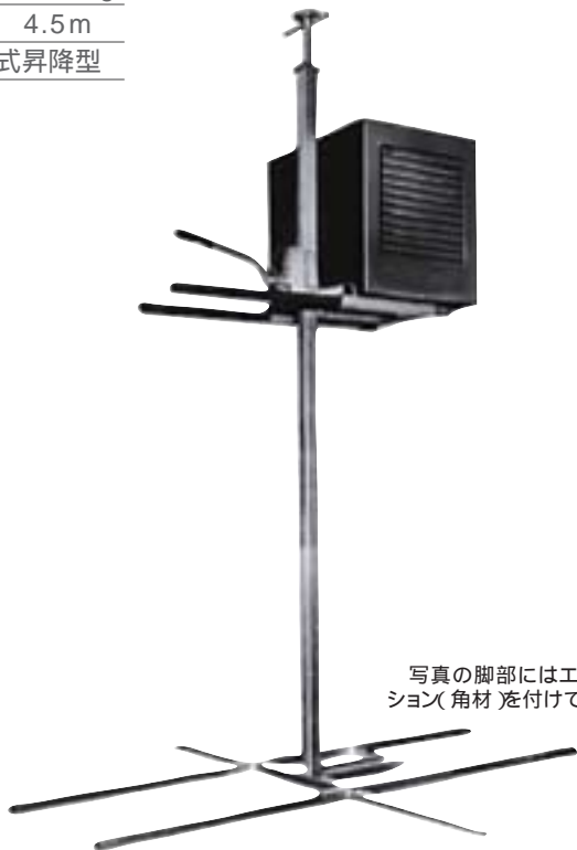
写真の脚部にはエキスパンション(角材)を付けています。